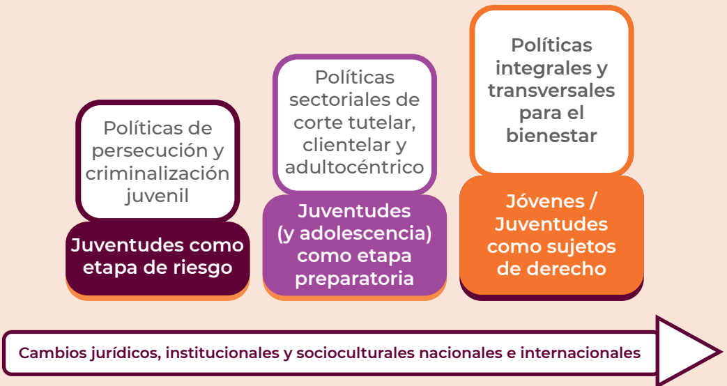
Figura 1. Devenir de las concepciones y modelos de atención hacia las juventudes

Vivencias propias, vinculadas a derechos que pueden ser ejercidos con responsabilidad y que (...) [exhiben expectativas que] remiten a situaciones existenciales plenas de legítimos reclamos para acceder a una educación mejor, para tener una atención completa en la salud, el respeto a su identidad, seguridad y vocación personal, el interés por una calificación profesional adecuada, para contar con políticas de apoyo para el primer empleo o una apertura adecuada a los bienes culturales, al deporte o al descanso recreativo (Bernales, 2012, p.21).