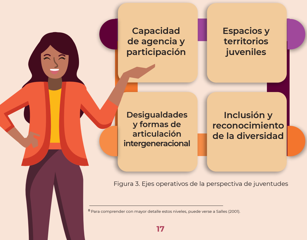
Figura 3. Ejes operativos de la perspectiva de juventudes

De tal forma que la puesta en práctica efectiva de esta perspectiva exige esfuerzos desarrollados a nivel micro, mezzo y macro, para lo cual se desarrollaron cuatro ejes operativos que, si bien son expuestos de manera individual, no operan de manera aislada ni excluyente, sino que se interpelan y funcionan de manera conjunta. Así, la PJ se centra en cuatro principales ejes: 1) capacidad de agencia y participación, 2) espacios y territorios juveniles, 3) desigualdades y formas de articulación intergeneracional y, 4) inclusión y diversidad.