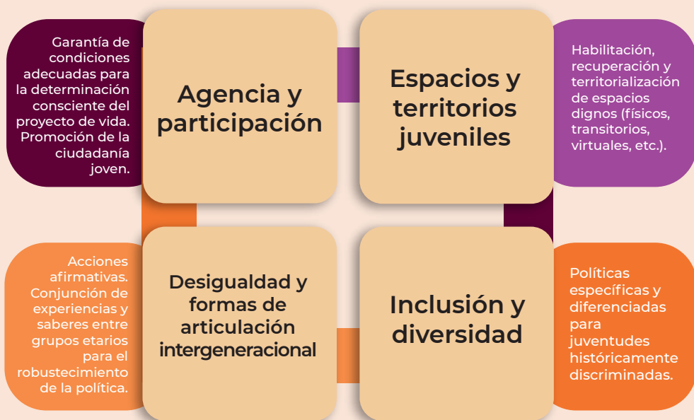
Figura 4. Descripción de ejes de la perspectiva de juventudes