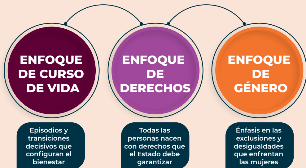
Figura 2. Principios de la perspectiva de juventudes

En su conjunto, estos elementos configuran los principios fundantes que dan forma a la PJ.